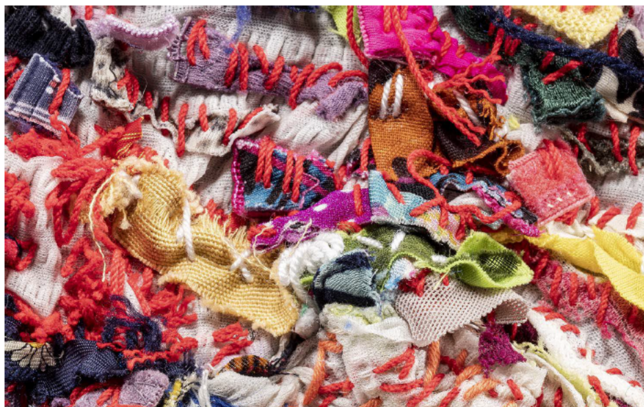
Georgina Maxim Shabby Agnes (détails), 2019 Textile, mixed media © Vincent Giner Dufourmes, 31 Project et Georgina Maxim